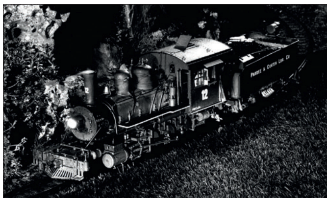
Tipps und Tricks für Aufnahmen der Gartenbahn bei Nacht, ab Seite 94

Titelseite: Einblicke in die Entstehung und den Betrieb einer Gartenbahn im alpinen Hochgebirge erlangten wir im schweizerischen Wengen, ab Seite 16